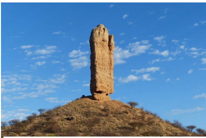
Die Vingerklip is 'n geologiese oorskiet van 'n Ugab-terras.

Die Vingerklip is die geologiese oorskiet van 'n Ugab-terras, sy geologiese geskiedenis kan soos 'n oop boek gelees word wanneer na die lae konglomeraat gekyk word. Die Rotsvinger staan op 'n heuweltop en het 'n hoogte van 929 m bo seespieël, die rots self is 35 meter hoog. Besoekers word toegelaat om die heuwel te klim om die rotsformasie te besigtig, maar dit is verbode om die Vingerklip te klim.