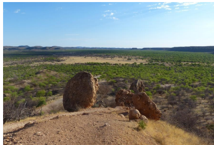
Uitsig vanaf die Vingerklip tot in die Ugab-vallei.